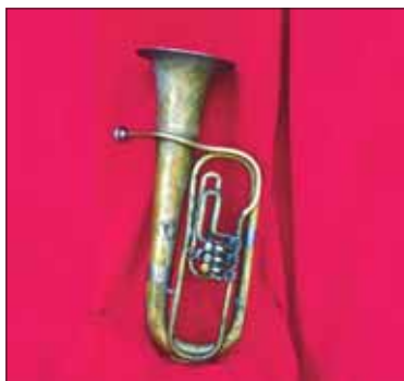
Fig. 1 - Flicorno tenore ( baritono ) fabbricato dalla ditta Ambrogio Santucci di Verona (l'iscrizione "Santucci in Verona" si legge sul padiglione, sotto un emblema musicale). In Italia lo strumento è noto con il nome di Bombardino e di solito ha tre pistoni a differenza di questo che ha tre chiavi. Dalla ditta Santucci, "Fabbrica Privilegiata d'Istrumenti Musicali", fornitrice della "Reale Marina" la Società Filarmonica Belfortese acquistò strumenti, parti di ricambio, ecc. (ved. docc. n. 14, 15, 16, 17 e 50 della cartella di Documenti Storici, nell'Archivio della Banda).

stata una trasformazione e residuo di questi complessi che, regolarmente stipendiati, accompagnavano gli eserciti nelle battaglie, partecipavano alle feste, alle cerimonie ufficiali e ai tornei. Suonavano vari strumenti a fiato (trombe, pifferi) ed a percussione (tamburi e tamburelli): spesso si accompagnavano ad attori interpretanti scene con espressioni gestua-